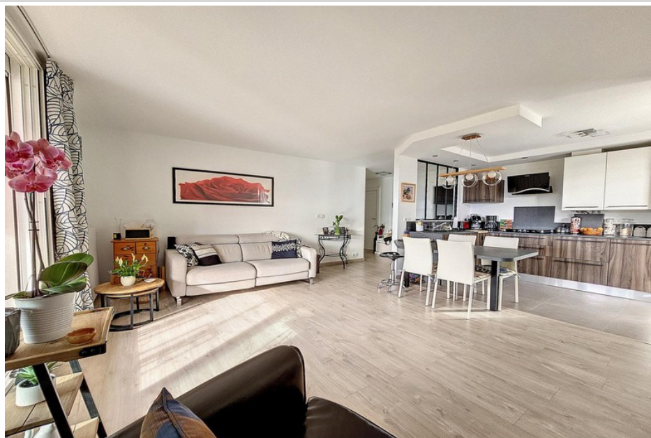
Apartment 178 Nice