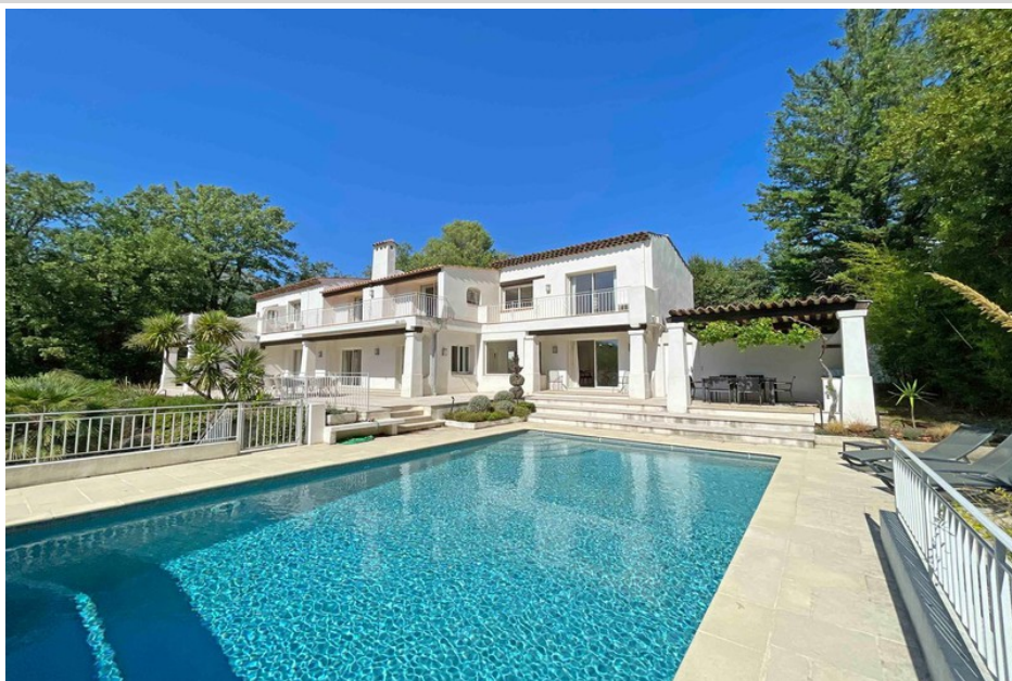
House 3499 Vence